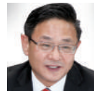
최병환 CJ CGV 대표이사 40기

KAIST AIM에서 시대흐름에 적절한 산지식을 접할 수 있었습니다. 제조업경영을 하면서 세계시장 확대를 위해 고민해 왔는데 AIM에서 방법을 찾았으며 Silicon Valley 해외연수는 큰 발전적 자극을 받았습니다. 밝은 미래를 꿈꾸는 분들에게 KAIST AIM을 적극적으로 추천 드립니다.